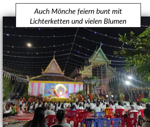
Auch Mönche feiern bunt mit Lichterketten und vielen Blumen