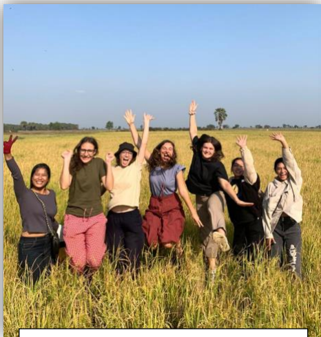
Ein Ausflug ins Reisfeld