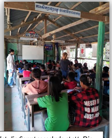
Hier in dieser Dorfschule findet die Sonntagsschule statt. Die Dormmädels, die früher auch in dieser Schule waren, helfen mit.