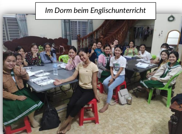
Im Dorm beim Englischunterricht