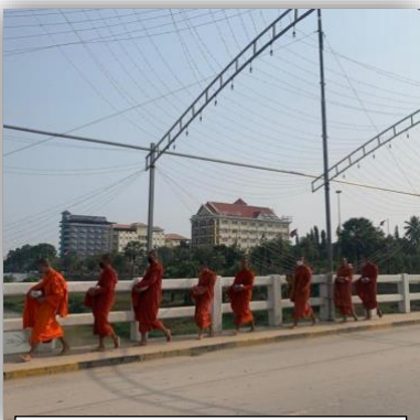
Im Gänsemarsch auf dem Weg zum nächsten Markt

Sie hat ihren Schulabschluss nachgeholt und jetzt auch ihr Studium abgeschlossen. Mit ganzem Herzen setzt sie sich als Vorschullehrerin ein, ist glücklich verheiratet und strahlt ein Selbstbewusstsein aus, was für Kambodschanerinnen eher untypisch ist. Sie ist eine große Ermutigung für mich und ich bin dankbar für die Gespräche mit ihr und auch die Einblicke in die Kultur, die ich dadurch gewinne.